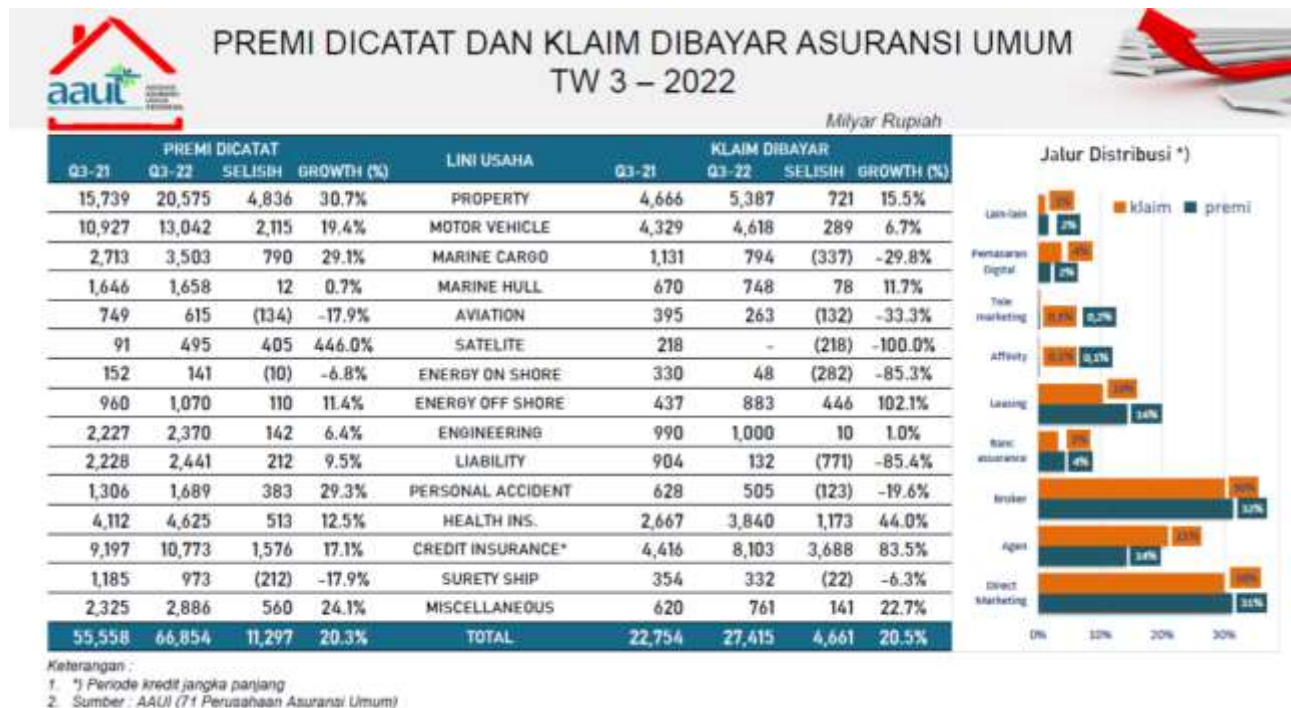
Tabel Premi & Klaim Per Lini Bisnis Triwulan III – Tahun 2022